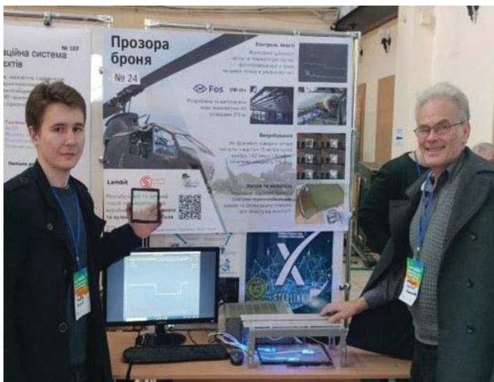
Рис. 2. Українські вчені створили унікальну технологію виробництва «прозорої броні» [33, с. 13]

та безпеки України, бачення науковою спільнотою шляхів повоєнного відновлення нашої держави (рис. 2).