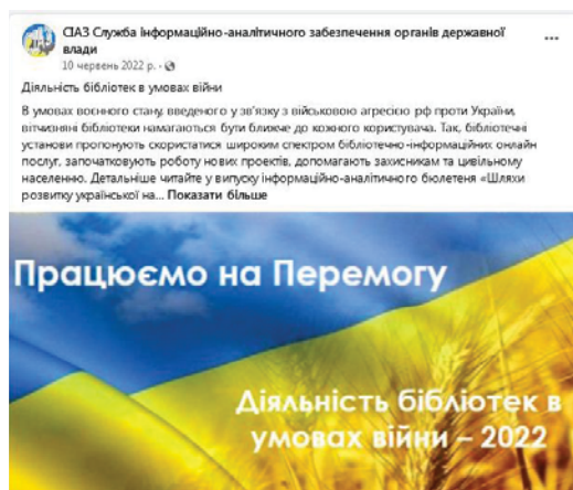
Рис. 7. Анонс до випуску інформаційно-аналітичного бюлетеня «Шляхи розвитку української науки: суспільний дискурс» зі сторінки СІАЗ у фейсбук.