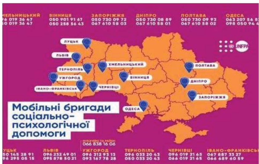
Рис. 5. UNFPA надає соціально-психологічні послуги постраждалим, які пережили насильство, у 13 містах України [35, с. 243]

бібліотеки та приклади сервісних послуг з підтримки постраждалих від кризових ситуацій: надання інформації про законодавче забезпечення постраждалих від стресу, державні програми та волонтерські й громадські організації, що забезпечують реабілітацію і підтримують постраждалих; про організацію в бібліотеках зустрічей із представниками владних структур, психологами, юристами та іншими фахівцями для різнопланових консультацій та розв'язання проблем громадян, які перебувають у стресових ситуаціях через втрату рідних, відсутність житла, роботи тощо (рис. 5).