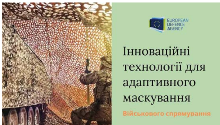
Рис. 3. Проектний офіс Львівської політехніки пропонує до уваги науковців конкурс військового спрямування від Європейського оборонного фонду – «Інноваційні технології для адаптивного маскуванню» [34, с. 25]