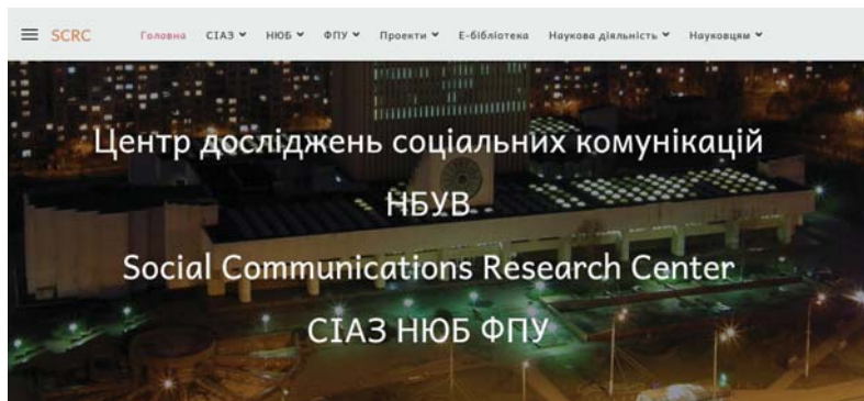
Рис. 6. Головна сторінка ЦДСК.