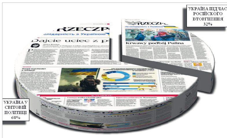
Рис. 1. Співвідношення тематики публікацій про Україну у виданні «Rzeczpospolita» (24 лютого – 18 червня 2022 р.)

Аналіз показав (рис. 1), що польське щоденне видання «Rzeczpospolita» частіше висвітлювало міжнародну реакцію на війну в Україні (68% публікацій), ніж сам хід бойових дій та ситуацію всередині України (32%).