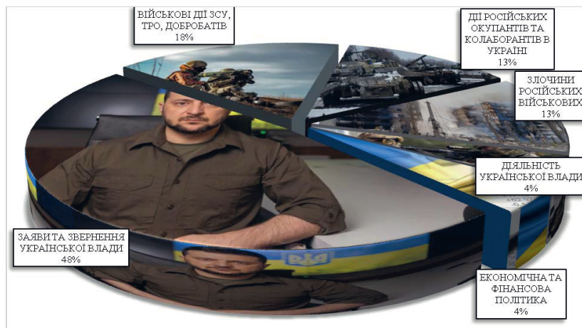
Рис. 2. Співвідношення тематики публікацій про внутрішню ситуацію в Україні під час російського вторгнення у виданні «Rzeczpospolita» (24 лютого – 18 червня 2022 р.)

і Україна «забере в Росії все, що вона забрала... І це лише питання часу. Кожен день наближає українців до звільнення».